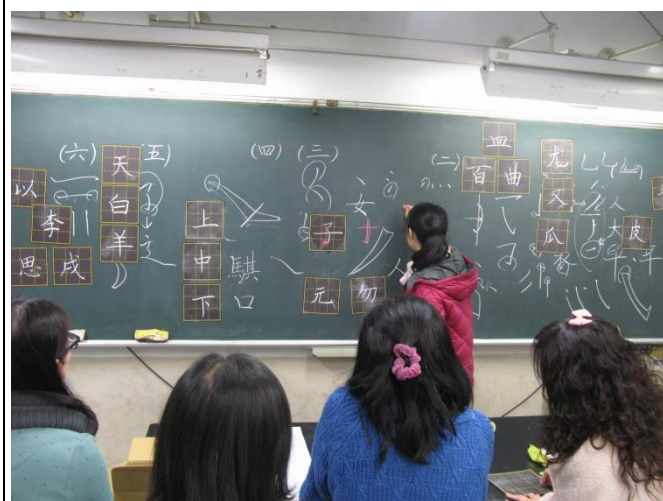
講師說明筆法、結構重點，示範一般學生常見的書寫缺點