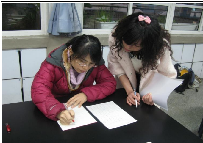
講師批改社員作業