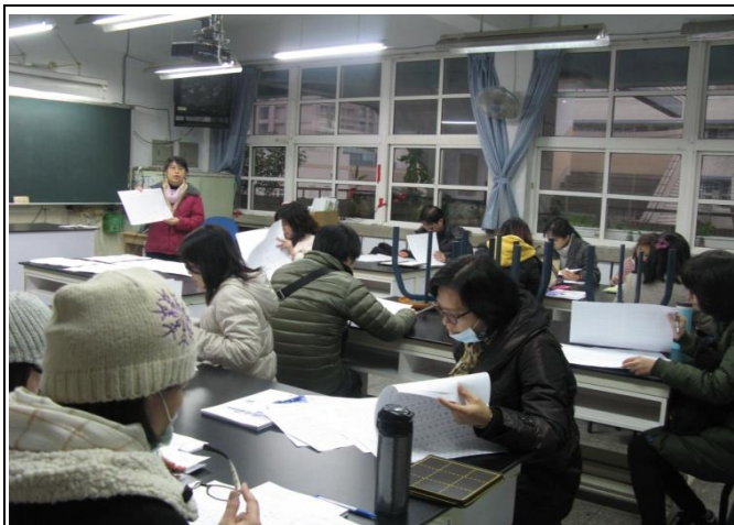
說明新北市自編硬筆書法教材的設計原則及使用方式，介紹本學期社群使用的教材