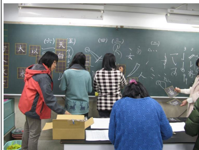
社員練習板書，討論，修正