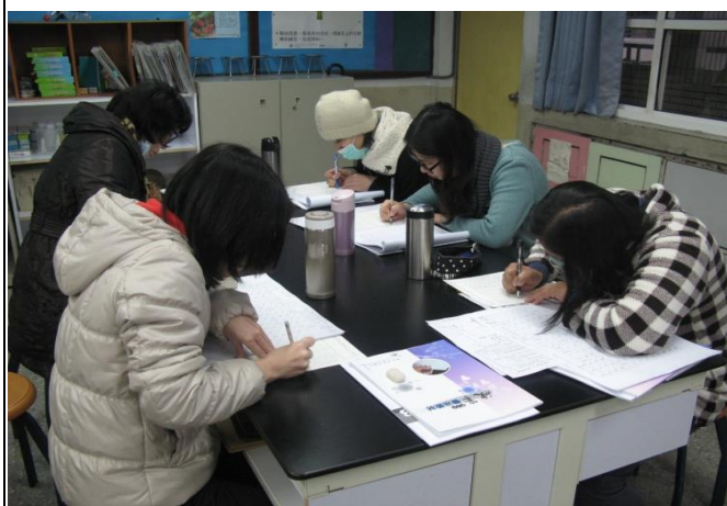
社員練習書寫硬筆字